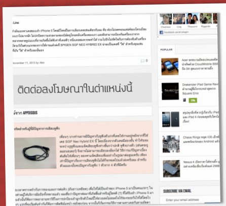
ก่อนเข้าบทวิจารณ์และก่อนจบบทความ

บทวิจารณ์ ข่าวสาร และบทความในเว็บไซต์ทั้งหมดล้วนแต่เป็นบทความคุณภาพที่เขียนโดยผู้นำเสนอบทความเองทั้งสิ้นเพื่อเอื้อประโยชน์ให้เกิดแก่ผู้สนใจและผู้ลงโฆษณาอย่างสูงสุด