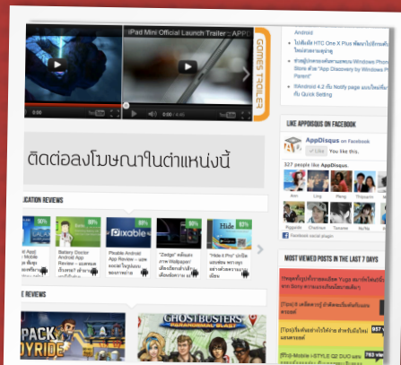
หน้าแรกระหว่างเกมเทรลเลอร์และรีวิว